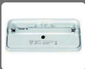
Detalle de conexión Connection detail