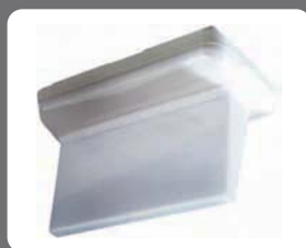
ST-25 Banderola Double sided diffuser