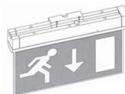
montaje pared frontal frontal mounting on the wall