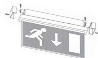
montaje techo directo ceiling mounting (direct)